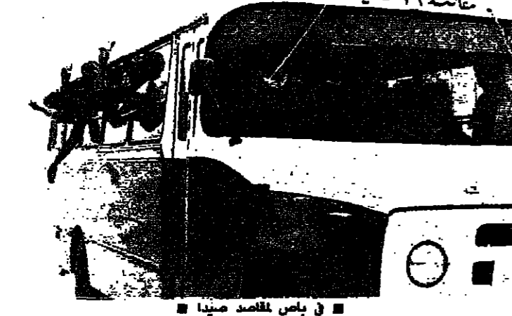
في باص للمساعدة صيدا

اصابت المطرانية المارونية ونجاة الطران حلوا باعجوبة اقتلى ٦ وجرح ٤ واجرحا في صيدا